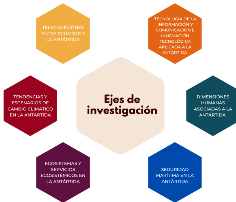
Figura 3. Nuevos ejes de investigación antártica

Los nuevos ejes se presentan en el siguiente esquema: